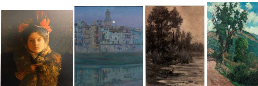
Retrat femení, c. 1890-1900. Oli s/tela.Col. particular / Nit de lluna a Girona, c. 1913-1915. Oli s/tela Md'A. / Paisatge, s/d llapis s/paper..Md'A / Paisatge, s/d. Oli s/cartró. Md'A.

Pintura, dibuix i text permeten traçar un itinerari vital de l'autor que mai va abandonar del tot la passió per pintar. La pintura esdevé un testimoniatge de la seva vida, de les seves incerteses, temptejos i, finalment, del seu alliberament a través de l'art.