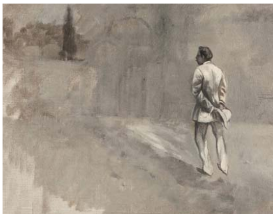
Estudi en gris, s/d. Olis/tela. Museu d'Art. Fons d'Art Diputació Girona