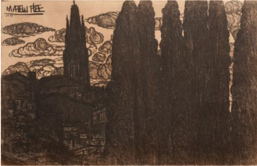
El campanar de Sant Feliu, 1921 Carbó sobre paper, 32 x 49 cm Museu d'Art de Girona, Núm. reg. 251.818

Segons el seu propi testimoni, Mateu i Pla va fer milers de dibuixos, però malauradament només se n'ha pogut localitzar una petita part. No obstant això, amb les obres que es coneixen, es pot constatar que li agradava dibuixar la mateixa vista utilitzant tècniques diferents, i així obtenir imatges que, tot i reflectir un tema idèntic, s'assemblen ben poc. En són un exemple aquests dos dibuixos de les muralles de Girona amb l'església de Sant Feliu —que tantes vegades apareix a la seva obra— al fons.