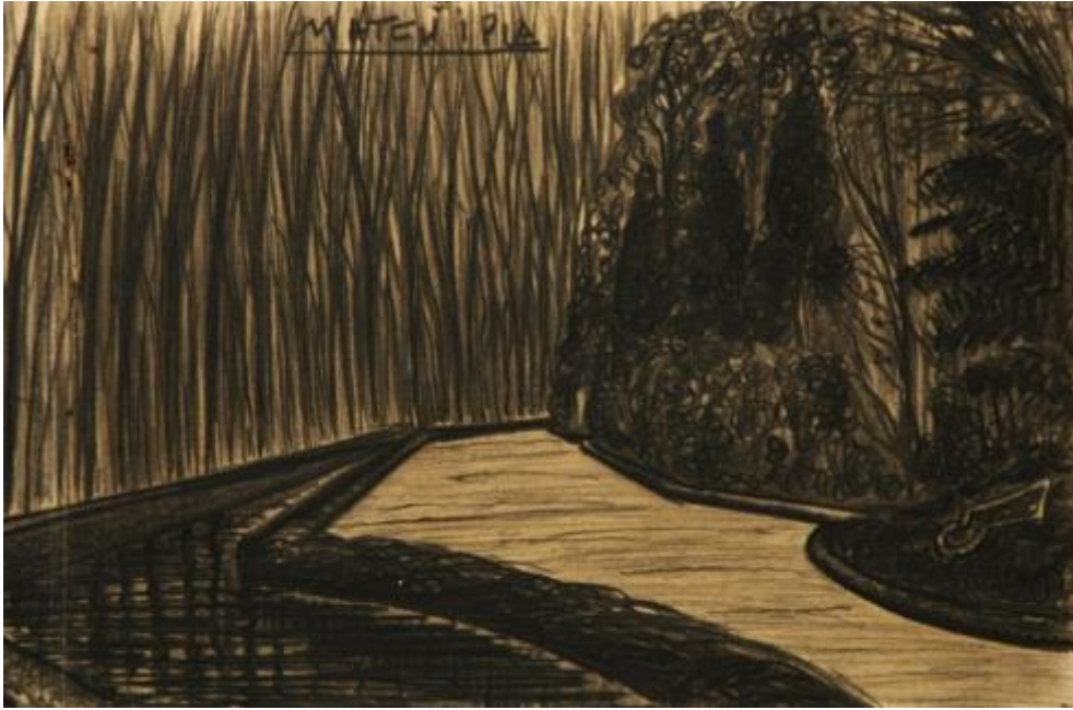
La Devesa i el rec, 1915 Carbó sobre paper, 31,4 x 47,3 cm Museu de Badalona, inv.2502