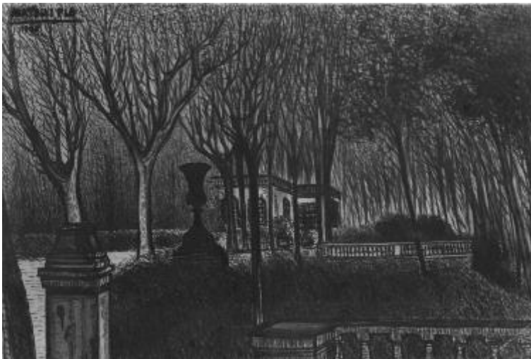
Parc de Can Solei, 1915

És l'obra més antiga que es coneix de Mateu i Pla. Es tracta d'un treball que va fer mentre estudiava a l'acadèmia del pintor Eduard Flò. Allà, un dels exercicis que practicava era copiar a llapis reproduccions en guix d'escultures famoses. En aquest cas, es tracta de Sembradora , una peça que va ser molt popular a final del segle XIX, de l'escultor i ceramista txec Friedrich Goldscheider.