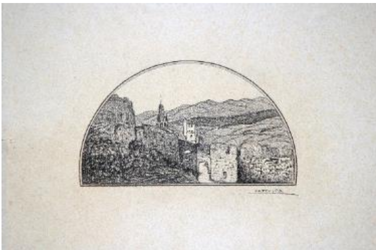
Muralles de Girona, primer quart segle XX Carbó sobre paper 31,5 x 47,2 cm Museu de Badalona, inv.2599