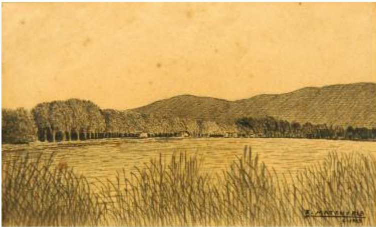
Llac de Banyoles, 1929 Carbó sobre paper 11,5 x 18,4 cm Museu de Badalona, inv.2505