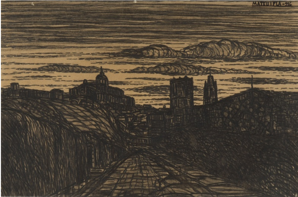
Els tres campanars de Girona, 1926 Carbó sobre paper 32 x 49 cm Museu d'Art de Girona, Núm. reg. 251.819

Els tres campanars característics de Girona: el de la catedral, i els de les esglésies de Sant Pere de Galligants i de Sant Feliu van ser un motiu recurrent en la seva obra. El dibuix, juntament amb altres, l'artista el va regalar al Museu d'Art de Girona. Aquesta obra en concret va estar inclosa a l'exposició «Paisatges de Girona. La mirada artística», organitzada el 2010 pel Museu d'Història de Girona.