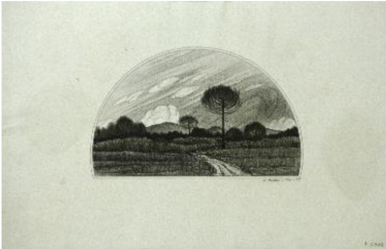
Paisatge, 1925 Llapis sobre paper 31,5 x 47,8 cm Museu de Badalona, inv.2303