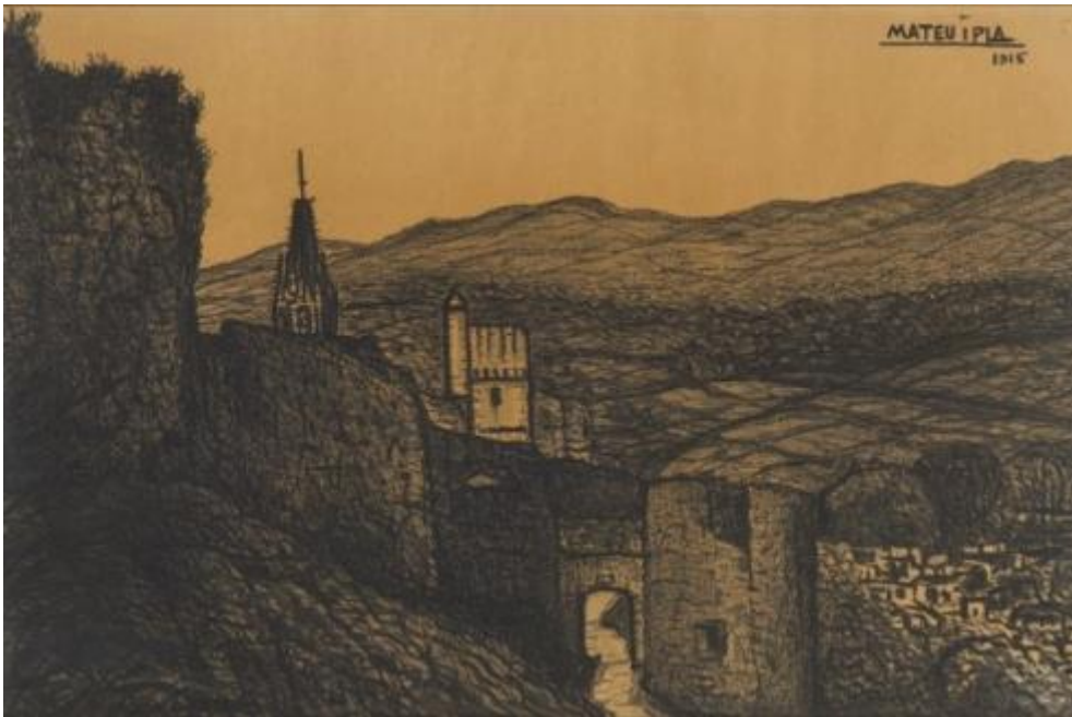
Muralls de Girona, primer quart segle XX Carbó sobre paper, 31,5 x 47,2 cm Museu de Badalona, inv.2599