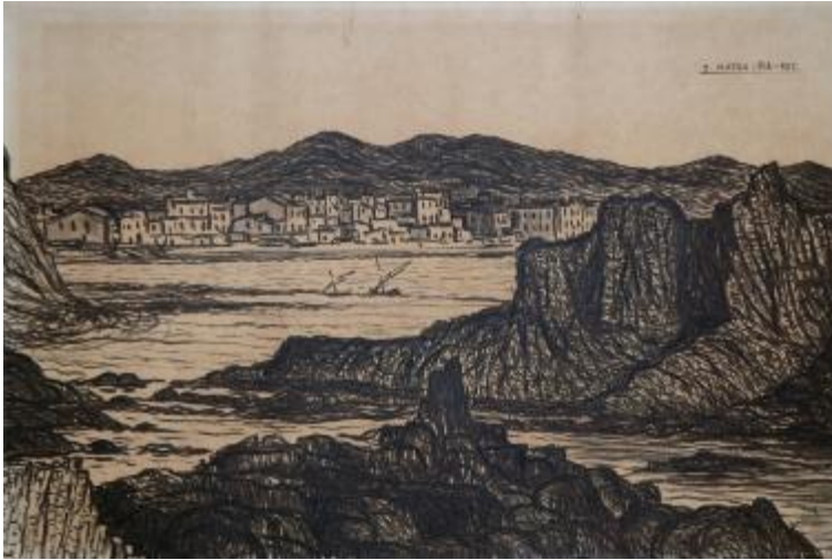
Lloret de Mar, 1926 Carbó sobre paper 32 x 47,8 cm Museu de Badalona, inv.2341