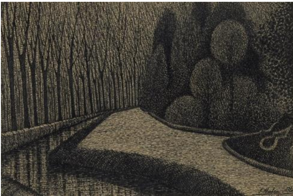
La Devesa, 1917 Ploma sobre paper, 20 x 30 cm Museu d'Art de Girona, Núm. reg. 250.244