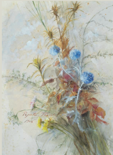
Pepita Teixidor Escardots. 1906 Aquarel·la sobre paper 48 x 37 cm Col·lecció particular