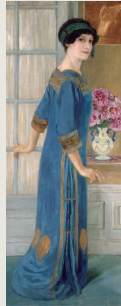
Clémentine-Hélène Dufau Autoretrat. 1911 Olí sobre tela. 180,5 x 70,2 cm

El fet que un artista, home o dona, passi a formar part de la història de l'art després de morir depèn de la suma de molts factors que s'encreuen i retroaccionen: que hagi tingut un recorregut històric d'exposicions; que tingui una fortuna crítica; que es conservi un conjunt d'obres considerable i en bon estat en col·leccions privades, museus o fundacions i que com a mínim algunes d'aquestes estiguin exposades; que es publiquin articles i assajos sobre la seva obra i, si és possible, es disposi d'un catàleg raonat; que li siguin dedicades exposicions antològiques o col·lectives, amb les catalogacions respectives; i, a més, que tingui una bona cotització al mercat.