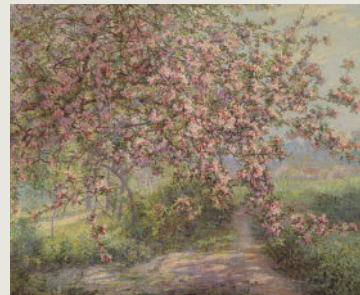
Juliette Wytsman Pomera en flor. 1906 Olí sobre tela. 101 x 121 cm Museum voor Schone Kunsten, Gant (Bèlgica)

Cap de les artistes de Feminal va gaudir d'aquestes circumstàncies, ni tan sols abans de morir. La subordinació del gènere femení, durant segles, els va impedir, en vida i després de mortes, que aquests factors d'èxit es concatenessin feliçment en la major part dels casos. Moltes d'aquestes dones van abandonar les seves carreres en casar-se o en tenir descendència i altres es desanimaven a causa de la forta pressió que exercia sobre elles una crítica totalment misògina i plena de prejudicis, que jutjava les seves obres en relació sempre amb el seu gènere. Posteriorment tampoc no van ser tingudes en compte per la història de l'art.