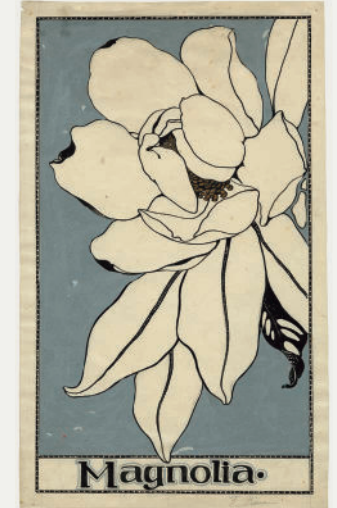
Francisca Rius i Sanuy Estudi de magnòlies (4 dibuixos). s/d Tinta i guaix sobre paper. 50 x 70 cm (marc) Col·lecció particular