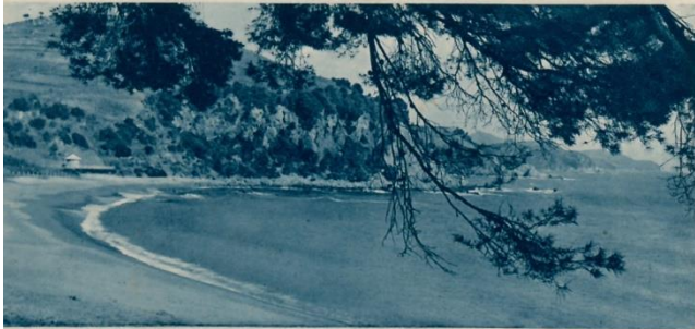
LLORET - PLATJA DE STA. CRISTINA