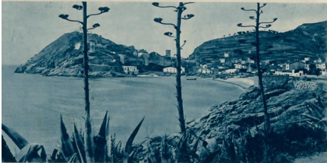
TOSSA DE MAR