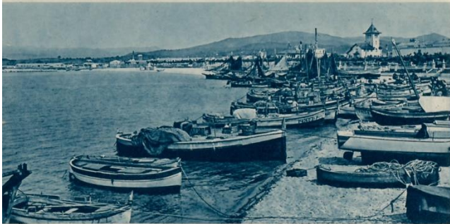
PALAMÓS - PLATJA I PASSEIG