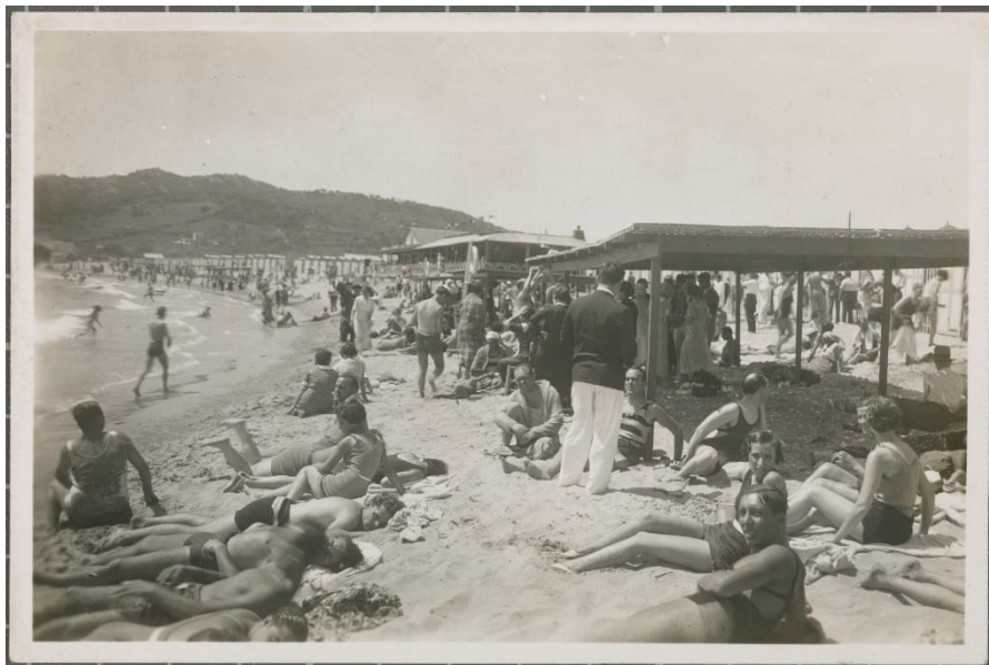
Platja de S'Agaró. c.1930. Fons Industrias Químicas Tartáricas.