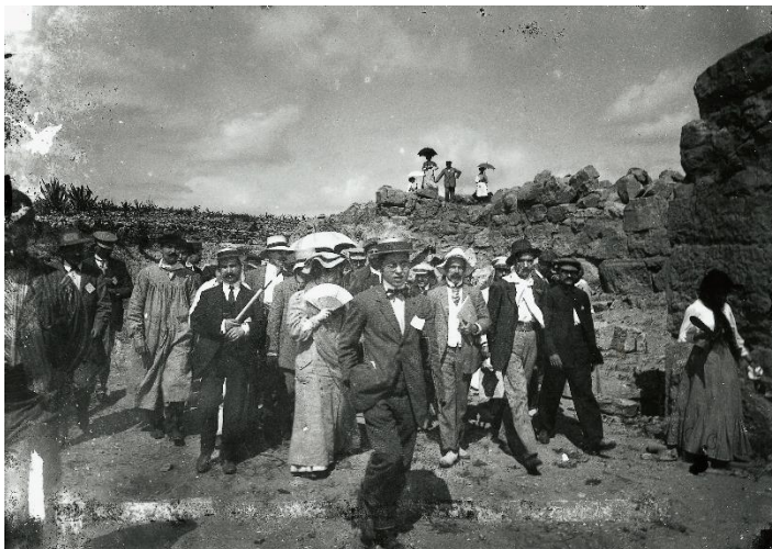
Un grup dels excursionistes visitant les excavacions d'Empúries sota el guiatge de Josep Puig i Cadafalch.

El naixement d'aquest topònim es va donar en el context de construcció de referents de país, en paral·lel al moviment polític i cultural del noucentisme. Des de llavors, polítics, escriptors i també artistes van ajudar a acabar de vestir la identitat d'un territori.