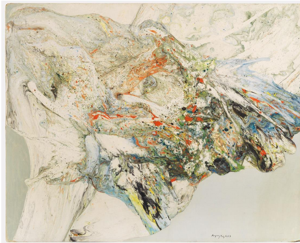
August Puig (Barcelona, 1929 - Girona, 1999) Ocell en vol 1957 Tècnica mixta sobre tela 81 × 100 cm Col·lecció particular, Barcelona

A Catalunya, dos dels representants més importants són Joan-Josep Tharrats i August Puig, que creen una pintura que es consolida per la turgència de les taques i que connecta amb una natura eminentment poètica i suggeridora, amb formes en què el resultat no és una deformació de la realitat sinó el pressentiment visionari d'altres realitats tant microcòsmiques com còsmiques.