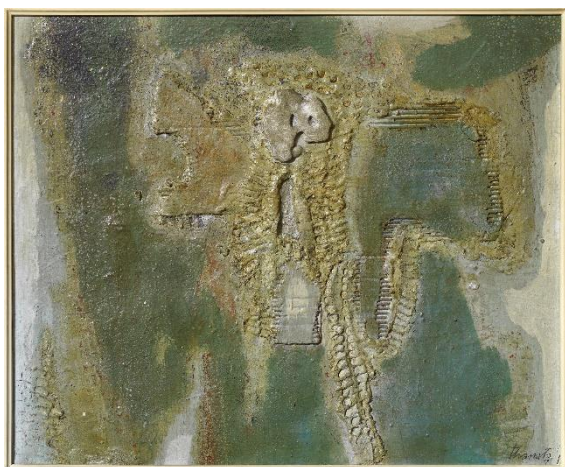
Joan-Josep Tharrats (Girona, 1918 - Barcelona, 2001) Fòssil 1957 Tècnica mixta sobre tela 54 × 65 cm Col·lecció particular, Barcelona

El nom d'aquest col·lectiu fa referència a la mida del bastidor (18 × 14 cm), que en el mercat s'anomena 0 figura i que utilitzaven per realitzar les seves obres. Un petit format que va ser emprat en la primera exposició dedicada a Velázquez, «Homenaje informal a Velázquez» (1960), en ocasió dels actes commemoratius del tricentenari de la mort del pintor. S'hi van aplegar quaranta-un autors que van presentar una obra en aquest format, amb un catàleg que també recollia frases i pensaments entorn de Velázquez, escrits pels mateixos artistes participants, a més de teòrics, historiadors, crítics, filòsofs, arquitectes i persones vinculades al món de la cultura.