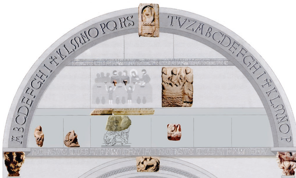
Dibuix reconstruït de la col·locació de l'escena del Lavatori dels peus al timpà superior de la portada de Sant Pere de Rodes: Zoilo Perrino.

tercer lloc, l'ús epigràfic de caplletres carolíngies en les composicions, puntejades amb forats fets amb trepant, com es veu a la X del PAX, és també una característica de l'obra del Mestre de Cabestany a Rodes, com testimonia el relleu de l'Aparició de Crist o el recentment descobert Titulus crucis que coronava la creu de la Crucifixió del timpà inferior. La inclusió de la inscripció «PAX» obeeix a un interès per distingir la figura de sant Pere, atès que a les seves epístoles, l'apòstol fa servir, com Crist, aquesta mateixa salutació (1 Pere 1, 2; 2 Pere 1, 2).