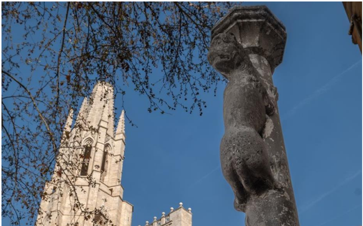
Còpia de la Lleona instal·lada a la plaça de Sant Feliu.

El Museu d'Art de Girona presenta “La Lleona de Girona. Noves aproximacions des de la història de l'art”, un estudi monogràfic sense precedents sobre un dels símbols més emblemàtics de la ciutat: la Lleona de Girona. Aquesta publicació, a cura de l'historiador de l'art Miquel Àngel Fumana, ofereix la revisió més exhaustiva realitzada fins ara sobre aquesta icònica escultura. La monografia proposa una anàlisi detallada de totes les informacions conegudes fins a l'actualitat sobre la columna, a més d'aportar dades inèdites i una descripció analítica de la peça. A banda, permet situar la peça dins un context artístic, i se n'ha pogut precisar la cronologia, la naturalesa material o les vicissituds que ha viscut des del segle XIX.