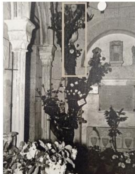
La Lleona a Sant Pere de Galligants, coberta per un muntatge vegetal en ocasió de “Temps de Flors”, 1965.